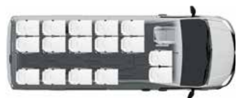
Autobús urbano / 16+1